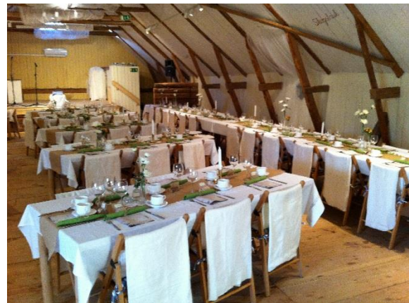
Exempel på placering: Honnörsbord dukat längs långsida, med småbord