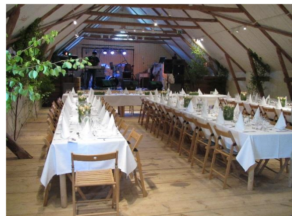
Exempel på placering: Honnörsbord med tre långbord